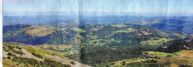
Plusieurs rencontres sont prévues. Une façon de créer du lien et de mettre à l'honneur les sommets de la montagne ardéchoise, comme ici les Boutières vu de Serre-en-Don.

La première édition de la manifestation « Rencontres aux sommets » aura lieu mercredi 23 août au soir. Une soirée ouverte à tous, toute association peut proposer un événement sur un point en hauteur différent avec une organisation d'activité ou autre. Dans ce même temps, les différents participants organiseront chacun de leur côté un moment d'échange convivial en toute simplicité autour d'un pique-nique par exemple. Pour les communes de Chanéac et Lachamp-Raphaël. Six sommets ont été retenus pour le 1 er juillet, et de ce sommet, on peut voir le Mont Chiniac, Rochelonne, le Serre en Don, Soutour, il s'agit de réunir, sur différents sommets choisis par les diverses associations participantes, un maximum de personnes. « Des personnes montent sur une hauteur proche de leur résidence pour s'y rencontrer, partager un moment festif et créatif, dans le même mouvement organisent une lecture du paysage, et visualisent les autres sites