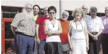
Une partie des initiateurs de ce projet très original.

Ce n'est pas pour faire mentir un célèbre proverbe qu'un collectif d'association et de personnes lance cette idée, mais bien pour créer des rencontres humaines et établir des communications. Suite au constat du morcellement du territoire, des associations motivées se sont retrouvées pour étudier et construire ensemble un projet global de manifestations communes et simultanées sur un vaste territoire incluant les Boutières et les plateaux. Le projet que les participants actuels envisagent, est d'amener le plus de monde possible sur les points hauts du territoire, au même moment, sur une soirée, voire une journée. Chaque association participante peut y proposer un spec-