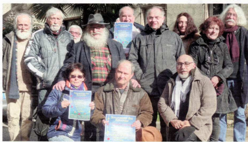
Le collectif s'est réuni au Cheylard afin de préparer l'édition 2018.