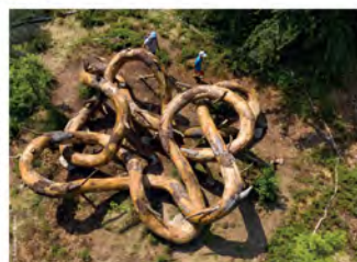
Le Mour de l'Abéouradou